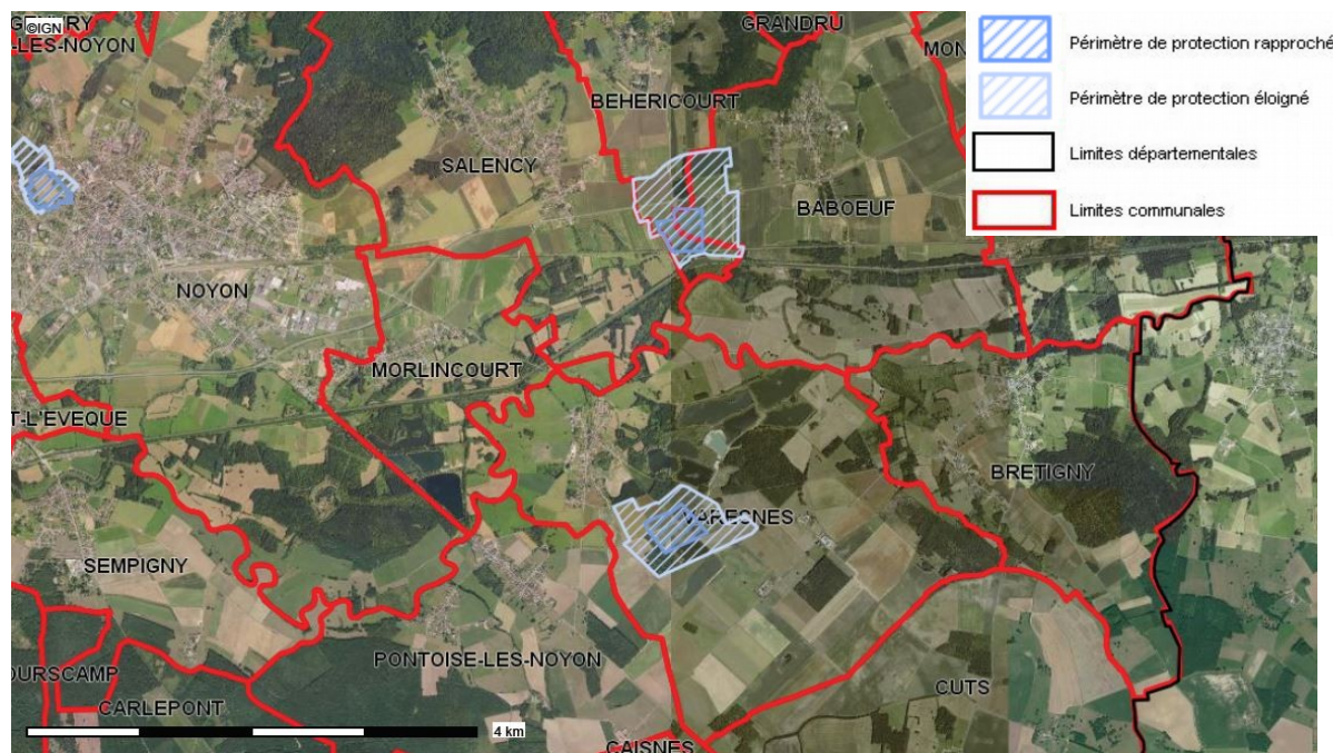
Carte publiée par l'application CARTELIE © Ministère de la Transition Écologique et Solidaire CP21 (DOM/ETER)